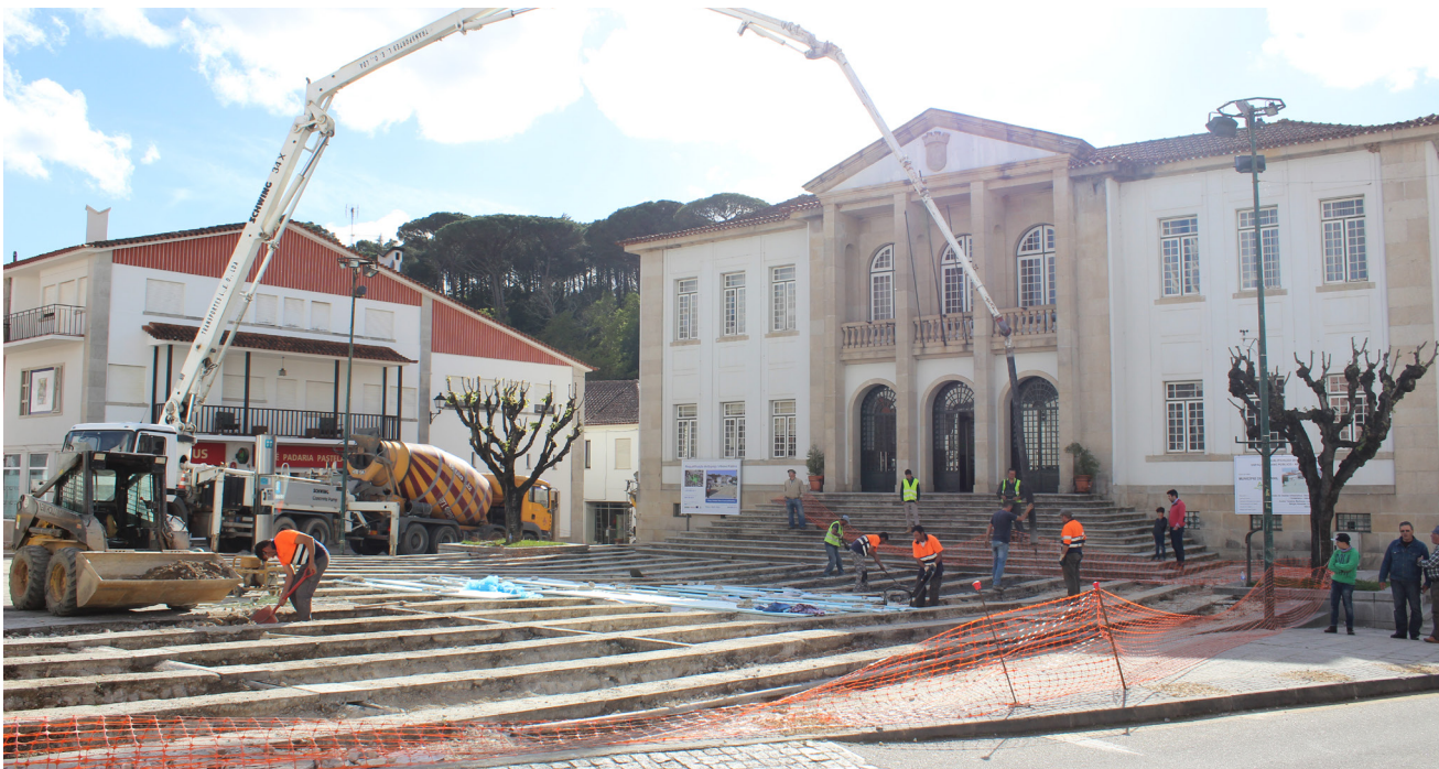
Requalificação do Espaço Urbano Público - Praça Simões Dias