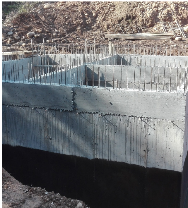
Construção de Estação de Tratamento de Águas Residuais (ETAR) de Pombeiro da Beira