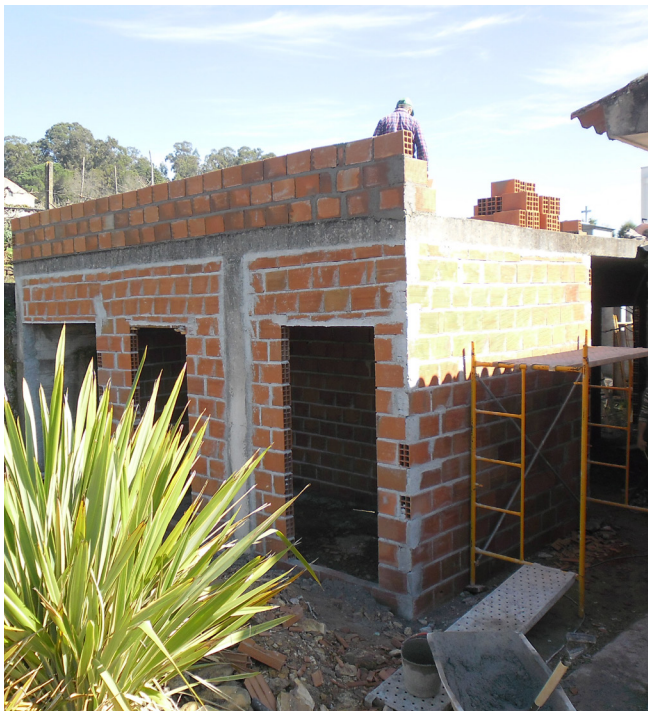
Requalificação de Imóvel para instalação da Extensão de Saúde de São Martinho da Cortiça