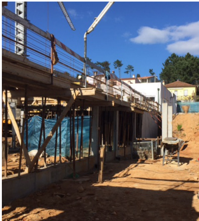
Reabilitação da Escola do 1ºCEB e Jardim de Infância do Sarzedo - Arganil