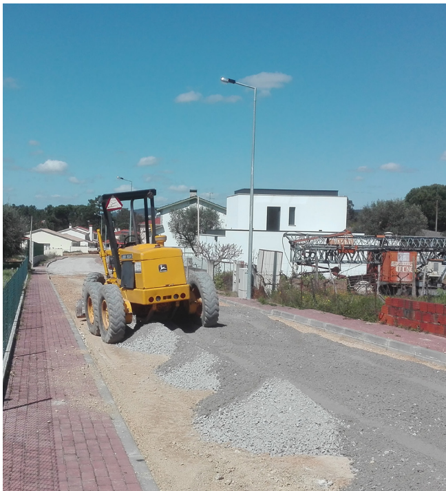
Rua Maria de Lurdes Ventura - Arganil (Rede Viária Oeste)