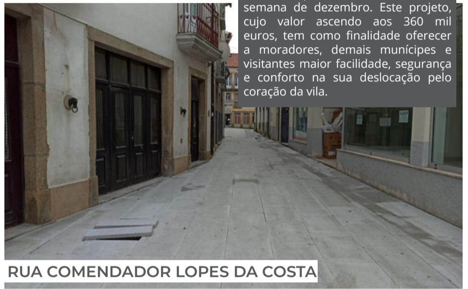
RUA COMENDADOR LOPES DA COSTA