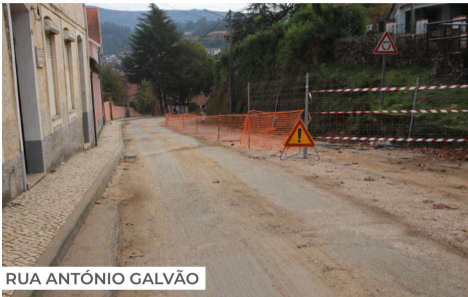
RUA ANTÓNIO GALVÃO

Em curso desde março deste ano, a empreitada de requalificação do espaço público de Arganil prossegue simultaneamente em quatro zonas distintas da vila. Enquanto no Largo Ribeiro de Campos e na Rua Comendador Lopes da Costa os trabalhos estão em fase de conclusão, na Rua António Galvão e Bairro do Prazo prevê-se que a intervenção esteja terminada em meados de dezembro. Quanto à Rua Jornal de Arganil, a reabilitação teve início no início do mês de novembro, estando terminada previsivelmente na terceira semana de dezembro. Este projeto, cujo valor ascende aos 360 mil euros, tem como finalidade oferecer a moradores, demais munícipes e visitantes maior facilidade, segurança e conforto na sua deslocação pelo coração da vila.