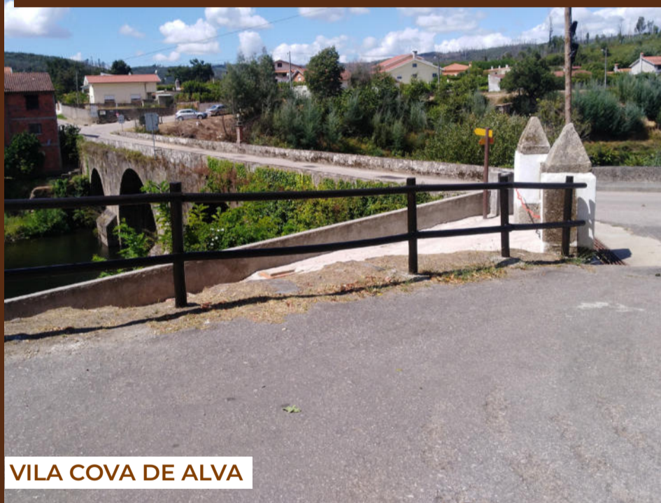
VILA COVA DE ALVA

Os gradeamentos afetados pelas chamas em outubro de 2017 foram repostos em Vila Cova do Alva, sede de freguesias, e nas localidades de Casal de São João, Vinhó e Anceriz. Esta reparação foi concretizada com base numa verba de 10.000,00€ transferida pelo Município de Arganil para aquela União de Freguesias.