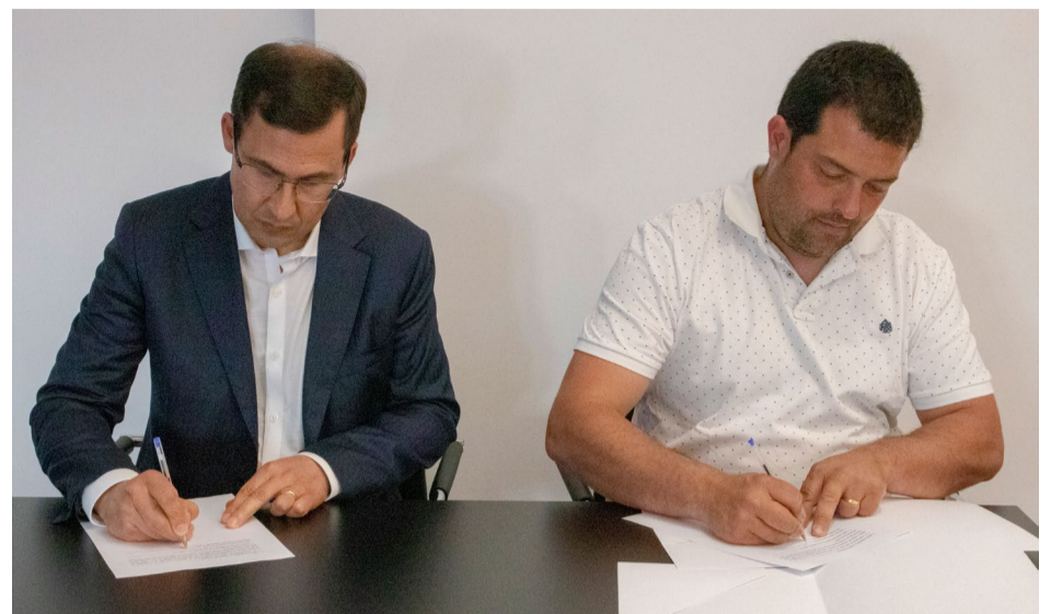
Assinatura do auto de consignação