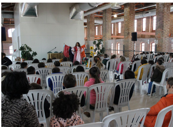
Visita das crianças dos Jardins-de-infância e Casa da Criança