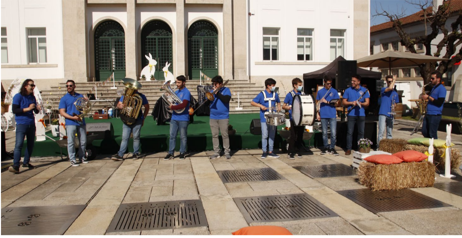
Grupo «Prata da Casa» da Associação Filarmónica Pátria Nova de Côja