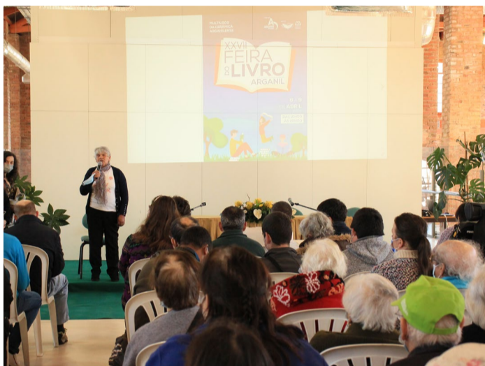
"Contos e Cantigas de Cá e de Lá"