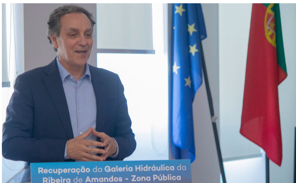
Intervenção de Pimenta Machado, vice-presidente da APA