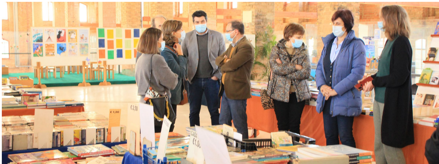
Inauguração da Feira do Livro