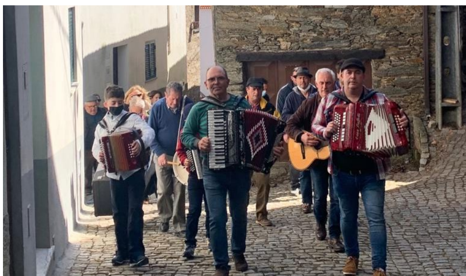
Pombeiro da Beira