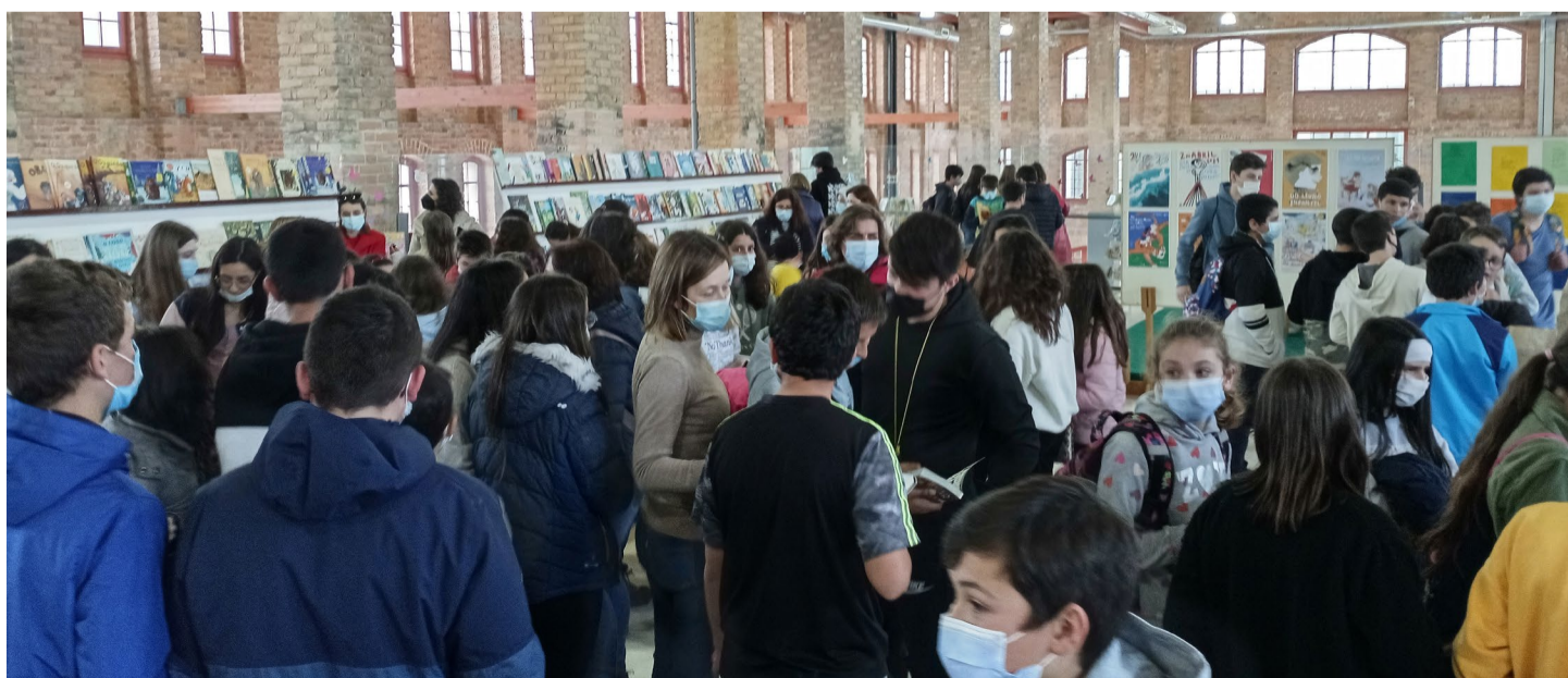
Visitantes da Feira do Livro de Arganil

Entre o dia 6 e 9 de Abril, e depois de dois anos de interregno a que a Pandemia nos forçou, decorreu no Espaço Multifusos da Cerâmica Arganilense a XXVII Feira do Livro de Arganil.