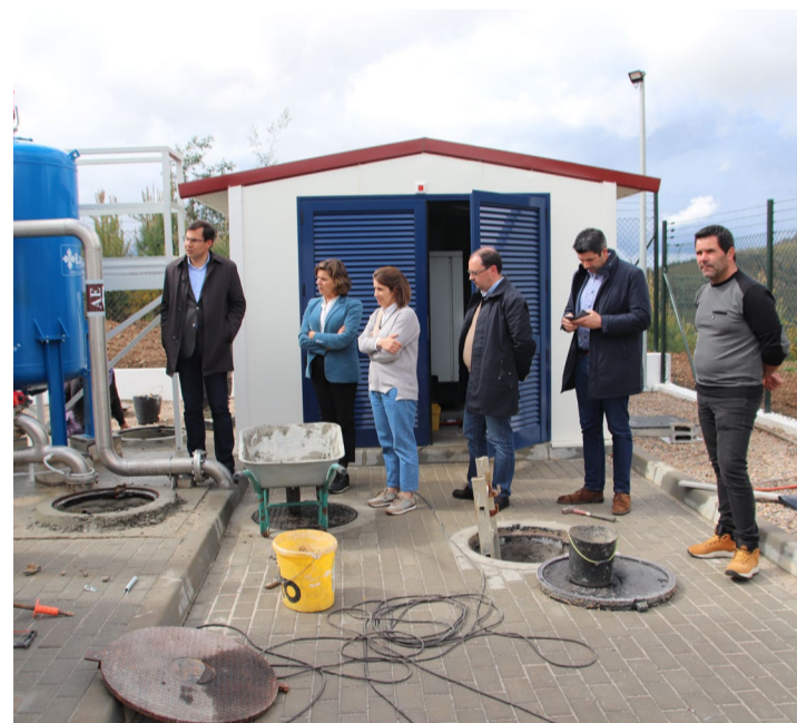
Visita às obras da Estação de Tratamento de Água de Pomares