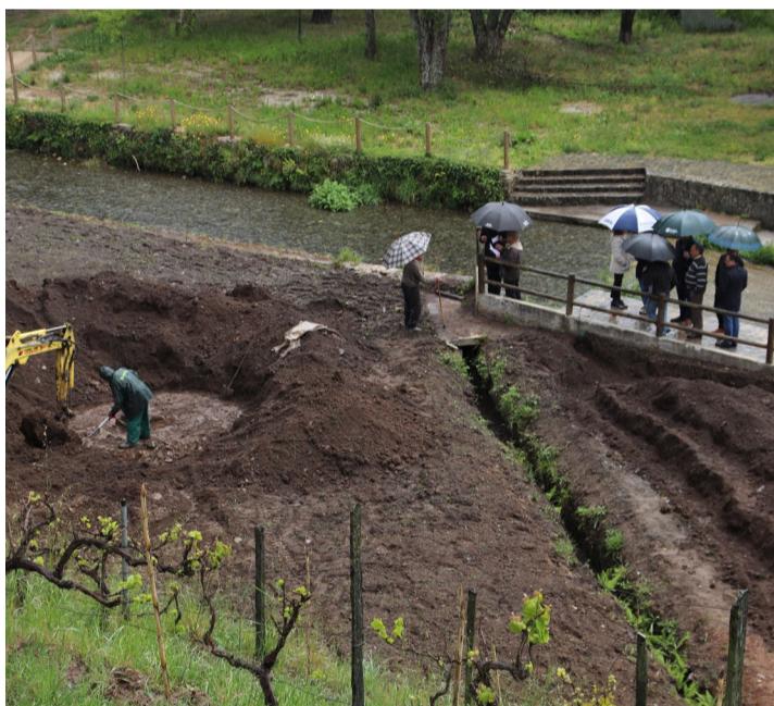
Visita às obras de melhoramentos da Zona Balnear de Agroal

A presidência participativa realizada na freguesia de Pomares é a primeira das 14 que se esperam ao longo do presente mandato autárquico; uma por cada uma das freguesias e uniões de freguesia do concelho.