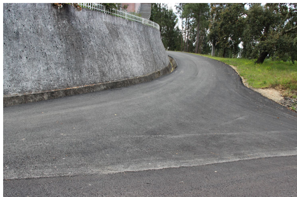
Acesso ao Parque de Merendas de Casal de S. José

A localidade de Casal de São José, na freguesia de Arganil, conta com dois melhoramentos concretizados recentemente pelo Município de Arganil: a repavimentação da estrada do Rebolal, que dá acesso à aldeia desde a EN 342 e ao parque de merendas, e o novo subsistema de saneamento, que permitiu avançar com a interligação à ETAR da Alagoa, suprimindo as duas fossas sépticas aí existentes.