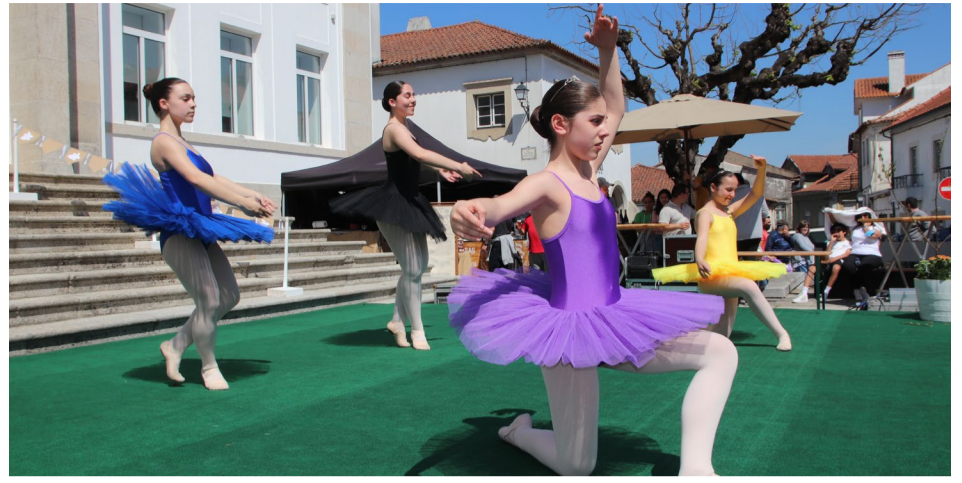
Alunas da Escola de Dança E.Motion EDS