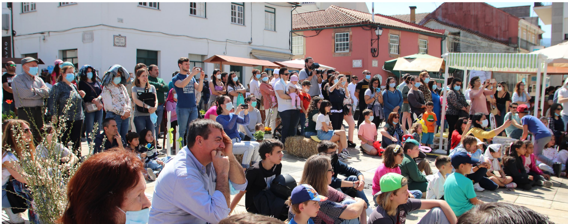
Páscoa na Vila decorreu na Praça Simões Dias, no dia 16 de abril

O Páscoa na Vila regressou após dois anos de interregno e trouxe consigo tudo aquilo que prometera: cultura, convívio e gastronomia, colorindo e animando o centro histórico da vila de Arganil.