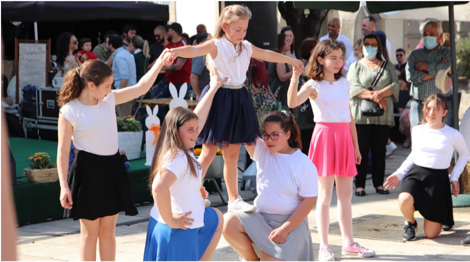
Grupo CojAnimar, do Rancho Infantil e Juvenil de Côja