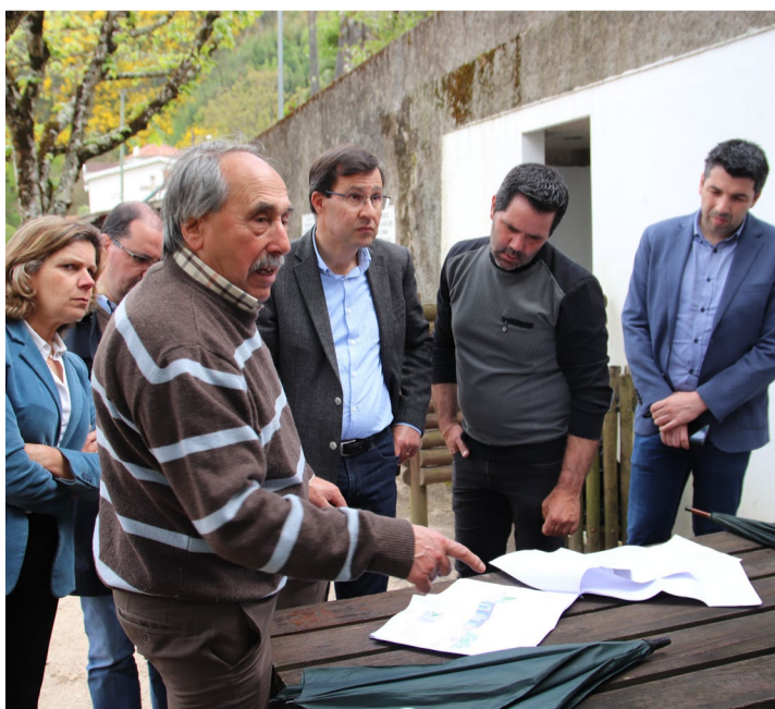
Apresentação de projeto de intervenção no bar de apoio à Praia Fluvial de Pomares