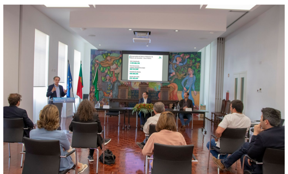
Apresentação da recuperação estrutural da galeria hidráulica

A intervenção de recuperação estrutural da galeria hidráulica da Ribeira de Amandos, que acompanha a avenida principal da vila de Arganil, vai avançar no início do mês de junho.