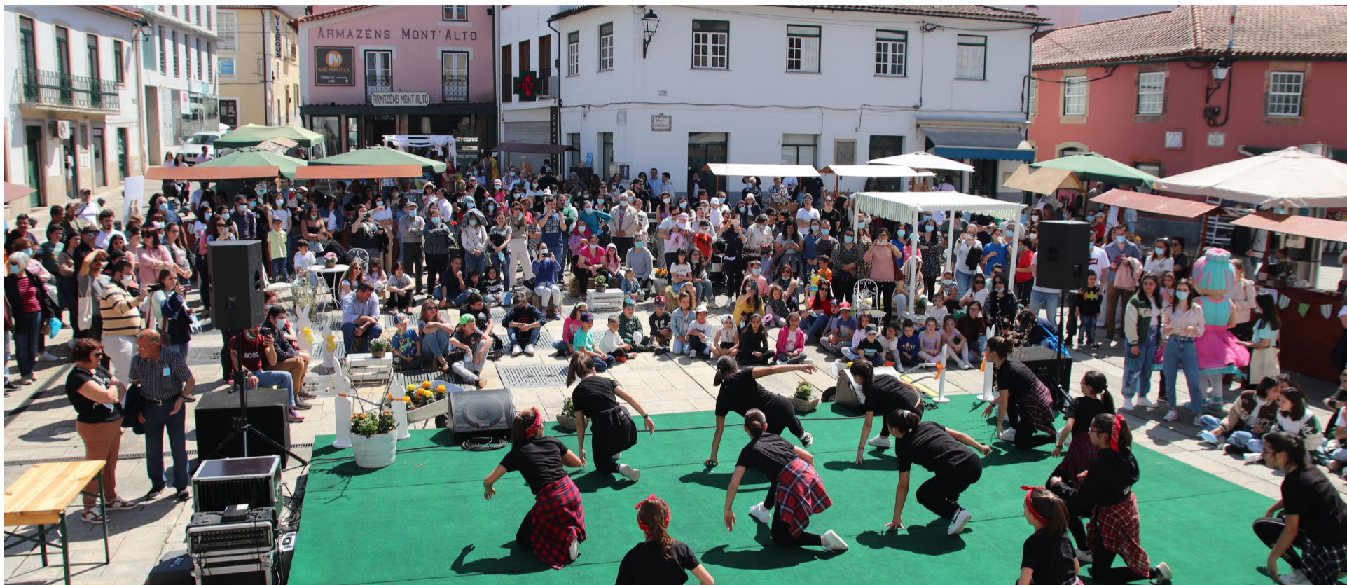
«The Boogies» - Escola de Dança E.Motion EDS