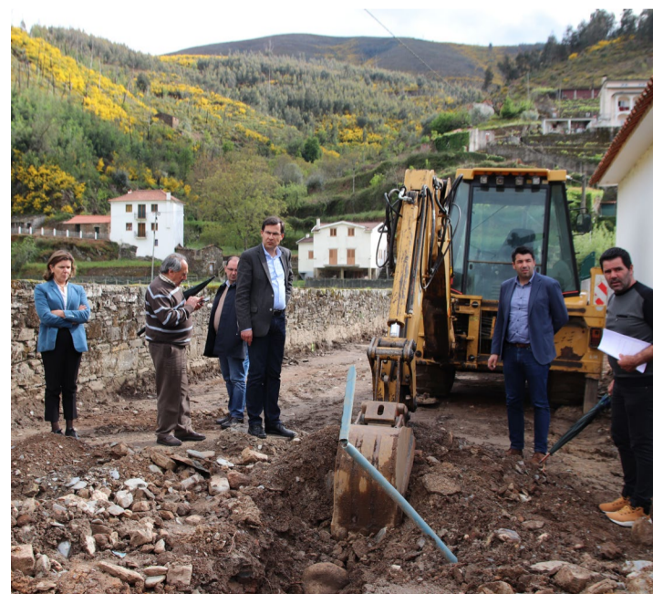
Visita às obras de reabilitação do sistema de abastecimento de água e de ruas em Pomares