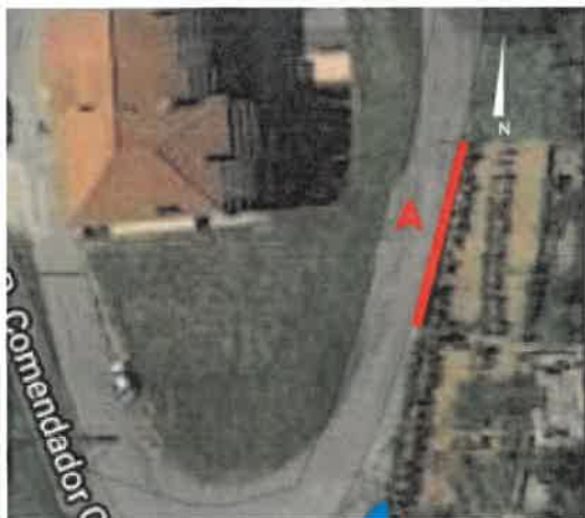
Imagem google – troço da intervenção

----- Proceder à demolição do muro e reconstrução do muro de suporte de terras confinante com a via pública, na extensão entre o poste de iluminação existente e o acesso à propriedade, conforme troço identificado na imagem Google e foto 6, bem como a consolidação do cunhal do vão de acesso foto 6, de forma que o mesmo deixe de constituir perigo para a segurança de pessoas e bens que circulam na via pública confinante, conforme estabelecido no auto de vistoria de onze de abril do ano dois mil e dezassete. -----