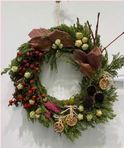
1º Coroa da Abundância