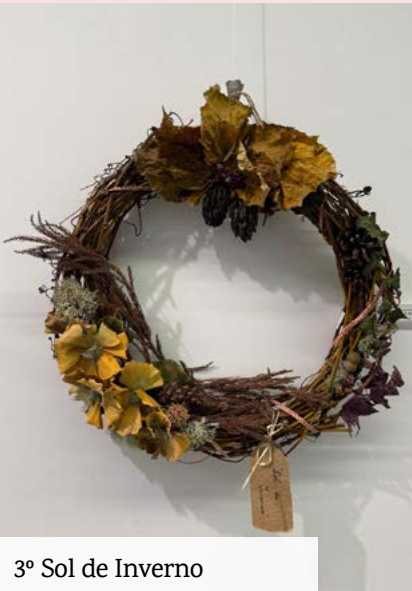
3º Sol de Inverno