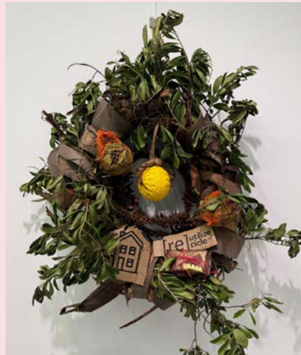
2º (Re)utilize (Re)cicle